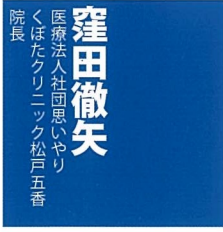
窪田徹矢 医療法人社団思いやり くはたクリニック松戸五香 院長