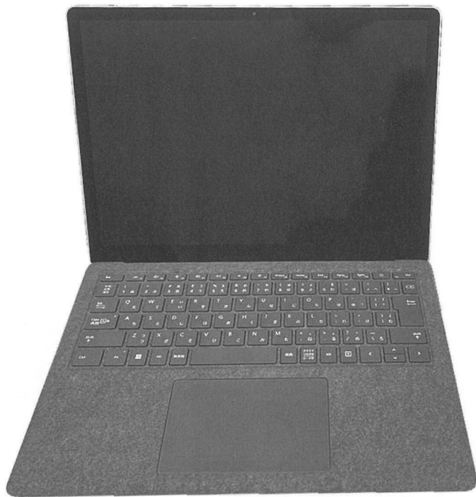
マイクロソフト社のノートPC「Surface Laptop4」

サービス「Googleドライブ」だ。数あるノートPCのなかで同モデルを愛用している理由を、院長は次のように振り返る。「実は、特段大きな決め手というものはなく、ホームページ制作に